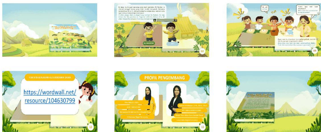
Gambar 2. Tampilan Desain Pop-Up Book Digital Bilingual Berbasis PowerPoint